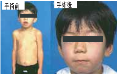
手術前 手術後 手術前にはアデノイドのために鼻づまりを生じ、口呼吸となっています。また、胸の変形とやせを認めます。手術一ヶ月後のひきしまった表情をみると、いかにいびきによる呼吸障害・睡眠障害のひどさがわかります。