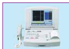
肺年齢を測定する スパイロメーター