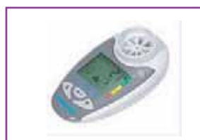
肺機能測定機器 ハイチェッカー