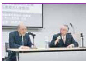
足立サンソ友の会代表の患者さんによる体験談