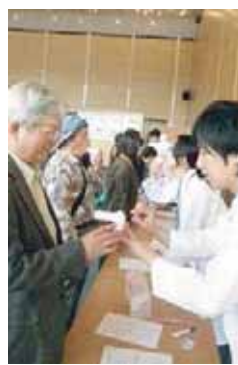
当院スタッフによる肺年齢チェック