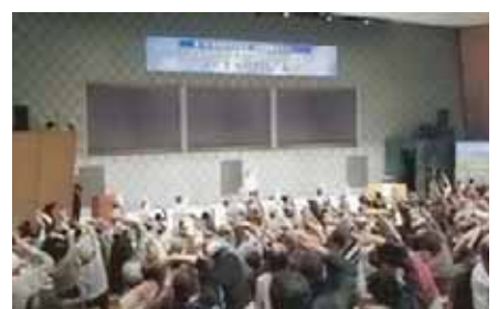
参加者全員で健康体操♪