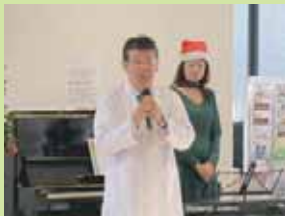
院長がクリスマス会 10 年目を迎えた喜びと思い出をお話しました☆

昨年 12 月 24 日に病棟クリスマス会を催しました♪ 院長の挨拶からスタートし、毎年恒例となっているどどんぱ山田バンドによるクリスマス JAZZ を患者さんにお届けしました☆