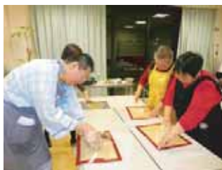
一生懸命にパンを練っています！