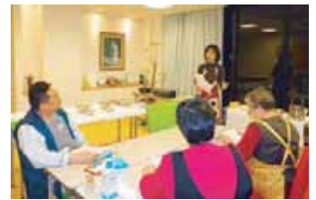
ヘルシーな情報を皆さんに提供しています♪

パン作りでは生地から具材までカロリーを抑え、かつ美味しい調理方法で参加した方々も夢中になって料理をされていました！料理が完成して皆さんで試食会をしましたが、ヘルシーなのにお腹も満たされて味付けも美味しいと好評でした☆ これからも定期的に開催しますので、参加をお待ちしています☆